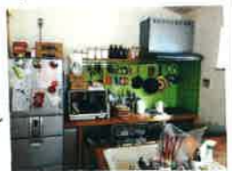
わが家のキッチン

弊社のウェブサイトで「家づくりメモ帳」の連載を始めました。世の中にハウスメーカーや設計事務所は沢山存在します。ハウスメーカーさんは広告やモデルハウスなどで「自社の特徴を紹介」していますが、設計事務所はお客さんの側から見てとても分かりづらいです。そこで弊社が考えている家づくりの考え方を間取り、住宅設備、ライン、床・壁・照明・家具、どんな場所に住めばいいか、バージョンという項目に分けて、書いていく予定にしています。また弊社サイトをご覧になってみてくださね。