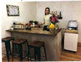
CROSS TALKはこんな感じです

私は恥ずかしいながら英語は超がつくほど苦手で、一度お伺いしてみようと思っております。街中の比較的交通のいい場所にありませう。