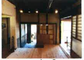
床は杉の無垢材に

いかんせんボランティアで運営している安楽亭は予算に限りがあるため「最小限のリフォームだけれど、できるだけ快適に過ごせるよう提案を心がけました。借りる予定の物件は築70年の木造平屋建。壁や天井は補修しない代わりに、床は木の無垢フローリングにして足ごわりの良い床にしました。照明は古民