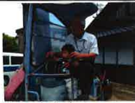
ユニホを運転しました

ちえのわ不動産はオーダメイド型の不動産屋さんです。お客様の探したい物件をお伺いしてから個別に探すというアナログな方法で物件探しを行います。