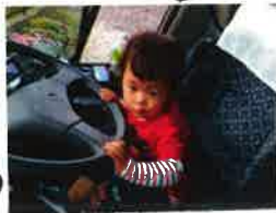
バスの運転楽しいな

ちえのわ不動産はオーダーメイド型の不動産屋さんです。お客様の探したい物件をお伺いしてから個別に探すというアナログな方法で物件探しをしています。バス運転楽しいなメールでもやり取りは可能ですが、実際にお目にかかる方がお客様の人となり分かるので探しやすいです。ぜひご来店をお待ちしております。