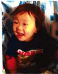
ヒノモックに興奮

メールでもやりとり可能ですが、実際にお会いする方がお客様の人となり分かるので物件が探しやすくなります。ぜひご来店もお待ちしております。