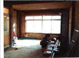
スクルトンになりまして

南方17日リバージョンも、工事が始まりました。内装を全て解体してスクルトン状態に。今まで3つの部屋があった2階はワンルームになってとても広い空間に！スクルトン状態になると、コンクリートブロックのゴツゴツ感が格好良く見えるようになるので不思議です。これから床を張