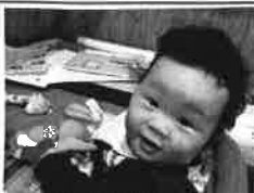
ボクもお仕事です！？

中納言町の自宅の一部を改造して家族3人で営んでいる不動産屋さん、設計事務所です。いつも7か月の息子連れでいるので子連れ不動産屋さんと呼ばれています。ちえのわ不動産は不動産業・建築設計業を通じて、住むことをトクトク楽しむ価値観を提供してまいります。パッと見た目は古かったりする建物でもシロな味わいをご活かす紹介をすれば、建物はよみがえるかもしれませんよ！ぜひご相談ください。